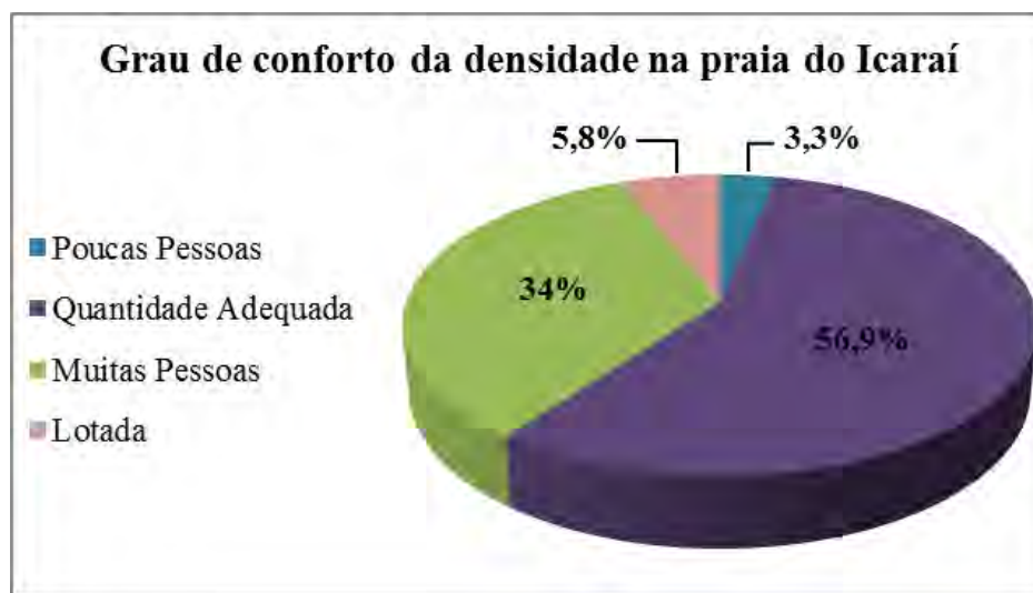
Figura 2 - Grau de Conforto em relação à densidade na praia do Icarai.

A maior parte dos entrevistados (91,6%), quando perguntados sobre sua preferência pelo nível de congestionamento ideal na praia do Icarai, revelou uma maior preferência por praias de moderado a baixo grau de aglomeração de pessoas, com níveis de densidades acima de 10 m 2 /usuário (Opção 2 na Fig. 3) e 25 m 2 /usuário. (Opção 1 na Fig. 03). Apenas 8,4% dos usuários preferiram a praia do Icarai com grau de congestionamento elevado, ou seja, uma capacidade de carga inferior a 5 m 2 /usuário (Opção 3 na Fig. 3).