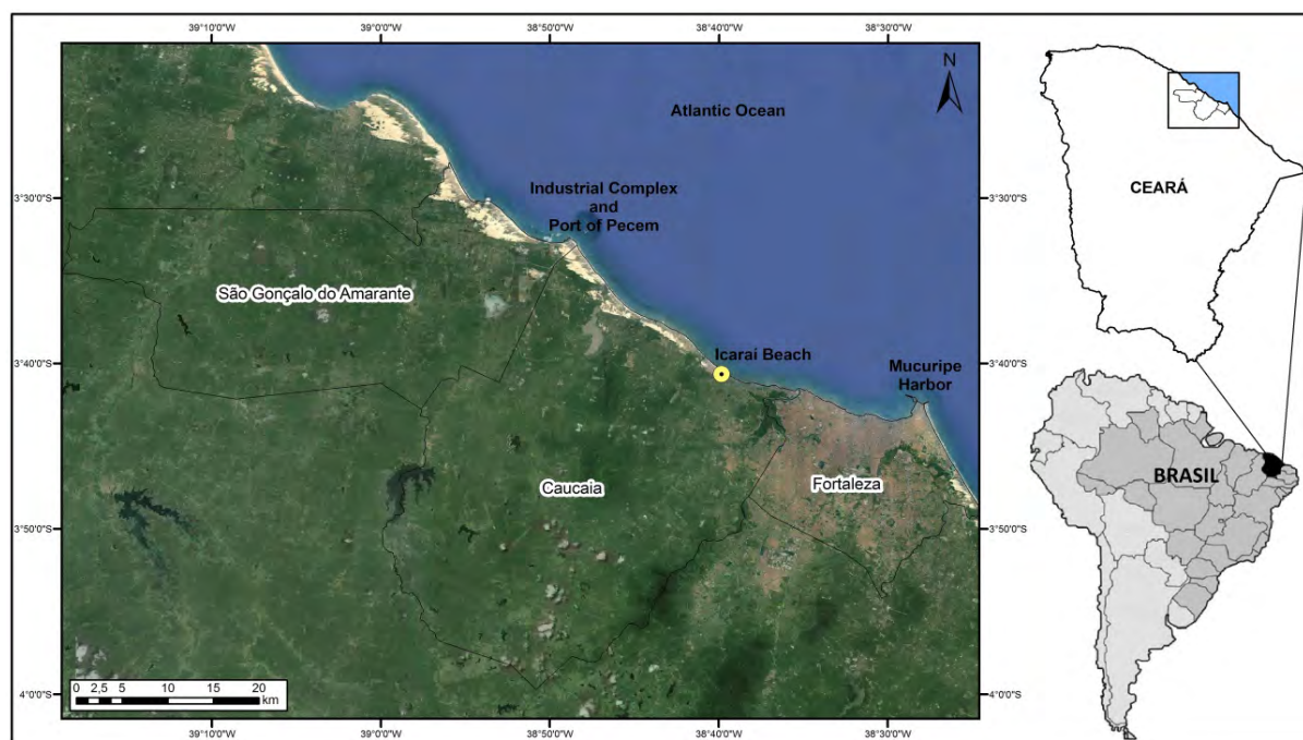
Figura 1 - Mapa de Localização da Praia do Icarai.

Somado a isso, os fluxos turísticos encontraram na Praia do Icarai as condições favoráveis para as atividades de recreação, lazer e a prática de esportes náuticos (Dantas et al. , 2008). Esta praia oferece as condições de ventos apropriadas para o wind surf e o kite surf , tendo sido apontada como um dos melhores lugares do mundo para a prática desses esportes (Silveira & Dantas, 2010).