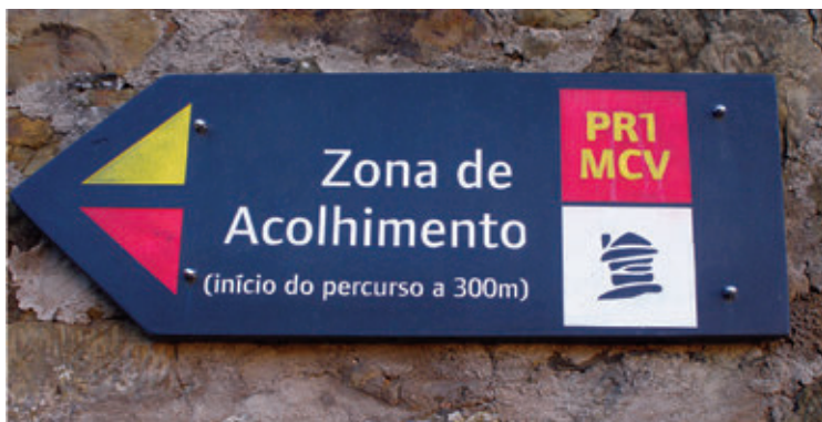
FIGURA 1. Placa indicativa/informativa de percurso pedestre (“Caminhos do Xisto”) em Gondramaz (Miranda do Corvo, 2009)

ponto de partida e o ponto de chegada são coincidentes. Especificando um pouco mais, podem enumerar-se outras configurações de percursos, além das indicadas, atendendo à forma do seu traçado. Braga (2007) refere ainda as formas em oito, em anéis contíguos, em anéis satélites e em labirinto.