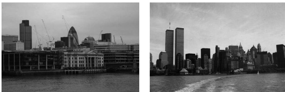
Figura 2 – A city de Londres e, em perspetiva, um dos símbolos da afirmação financeira da cidade: o edifício Gherkin . À direita, o skyline de Nova Iorque, em Manhattan, onde se destacam as torres do World Trade Center , destruídas em 2001.

Estes elementos patrimoniais, tal como os edifícios (os arranha-céus) que afirmam o poder de grupos empresariais privados e promovem um determinado modelo de desenvolvimento económico, são marcantes na forma como criam silhuetas de identificação ou sky-lines , que diferenciam cidades e lhes conferem personalidade. Em 2001, os atentados terroristas a Nova Iorque tiveram forte simbolismo também porque destruíram elementos emblemáticos da silhueta e da afirmação global desta urbe (Figura 2).