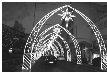
Figura 1 – Pormenores da cityscape de Elvas, em dezembro de 2006: um presépio na Praça da República e iluminação numa das principais artérias do centro histórico, a Rua da Cadeia.