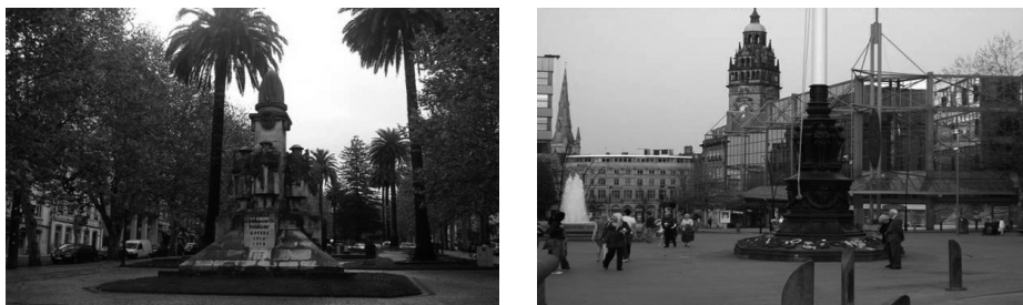
Figura 4 – Monumento aos Heróis da I Guerra Mundial, em Coimbra e, à direita, monumento evocativo dos Combatentes das I e II Guerras Mundiais, numa praça central de Sheffield.

É por isso que a paisagem urbana é um espaço simbólico instável que, no extremo, pode levar a um reordenamento toponímico e de estatuária sempre que se verifica uma mudança de regime político. Este facto, o derrube de estátuas, a mudança de nome de pontes, ruas e praças, faz das cidades um palco de confronto ideológico, que pode também justificar alterações na identificação de uma cidade. Esta mudança, comum nos processos de descolonização em África e na Ásia, pode estar associada a uma adaptação toponímica às línguas locais mas tem também o propósito de romper com o passado, pela vontade de autodeterminação de populações e territórios outrora pertencentes a impérios coloniais europeus. É assim que, por exemplo, Lourenço Marques se (re)batizou Maputo e Bombaim assumiu o topónimo Mumbai.