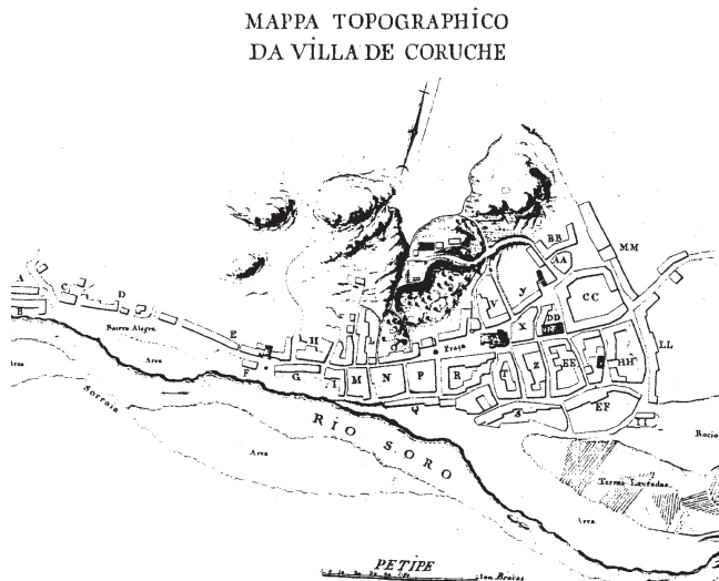
Figura 1 – Mapa da vila de Coruche, datado de 1789, publicado por Manuel Nazareth e Fernando de Sousa em A demografia portuguesa em finais do Antigo Regime – aspectos sociodemográficos de Coruche , vol. 4, Livraria Sá da Costa Editora, Lisboa, 1983, p. 69.

No devir, a matriz viria a ser, além do mais, a sede da Real Colegiada de São João Baptista (uma das mais antigas e ricas do reino), pólo aglutinador da vida religiosa de Coruche medieval, situada num ponto central do aglomerado urbano, que exercia com certeza um grande poder no seio da vila e seu termo. O edifício da igreja, no conjunto da praça, ganharia, ao longo dos séculos, uma volumetria considerável 20 , conforme se constata tanto na planta da vila de 1789 (Figura 1) como no levantamento parcial da praça realizado em 1824 (Figura 2) 21 .